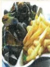
Plat du jour