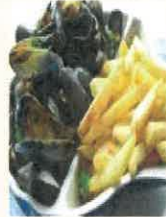
Plat du jour