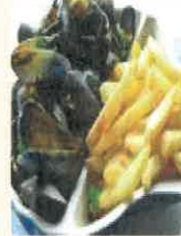
Plat du jour