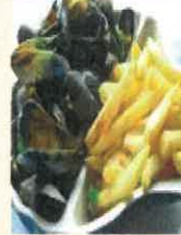
Plat du jour