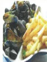
Plat du jour