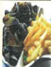
Plat du jour