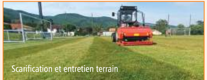
Scarification et entretien terrain