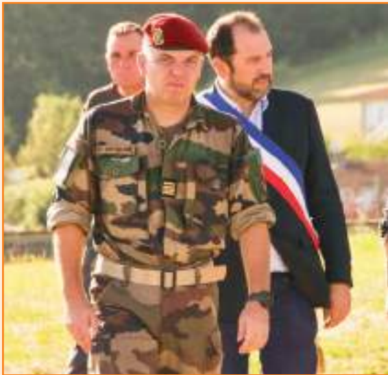
Arrivée du maire et du chef de bataillon