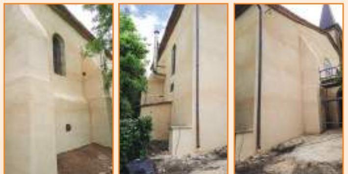
Réfection façade de l'église de Saint Pierre de Fronze