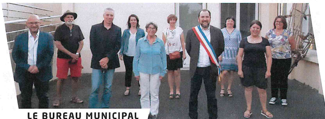
LE BUREAU MUNICIPAL